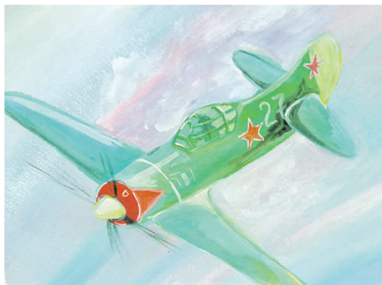
Воздушный бой. Рисунок Дмитрия Новикова (Корочанская школа им. Д. Кромского)