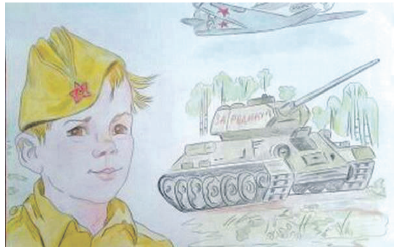
Рисунок Дарьи Лопиной (Корочанская школа им. Д. Кромского)